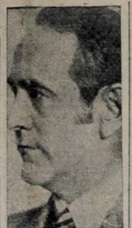
Sr. Oswaldo Aranha

O ex-chanceler Oswaldo Aranha manteve importante conferência com o general Góes Monteiro — Fórum discutidos varios assuntos, inclusive medidas de combate ao comunismo — Agitação na politica mineira — O PTB elege o Prefeito de Bagé, no Rio Grande do Sul