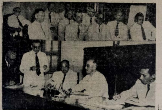
Dois aspectos da reunião da Sociedade Médica de Campina Grande, na qual foi eleita a sua nova Diretoria, constituída de nomes representativos dessa classe, em nosso Estado

O acontecimento que assinalou a escolha dos novos quadros dirigentes da Sociedade Médica de Campina Grande teve a melhor repercussão naquela classe, em face da competência e reconhecida qualidade profissional dos eleitos, que desfrutam de largo apreço entre seus colegas de todo o Estado.