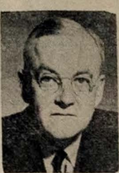
Sr. Foster Dulles

A Grã-Bretanha deseja uma Conferência dos Quatro Grandes — Desmentido o envio de novas instruções ao Marquês de Salisbury