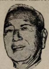
PREZ. SYNGMAN RHEE